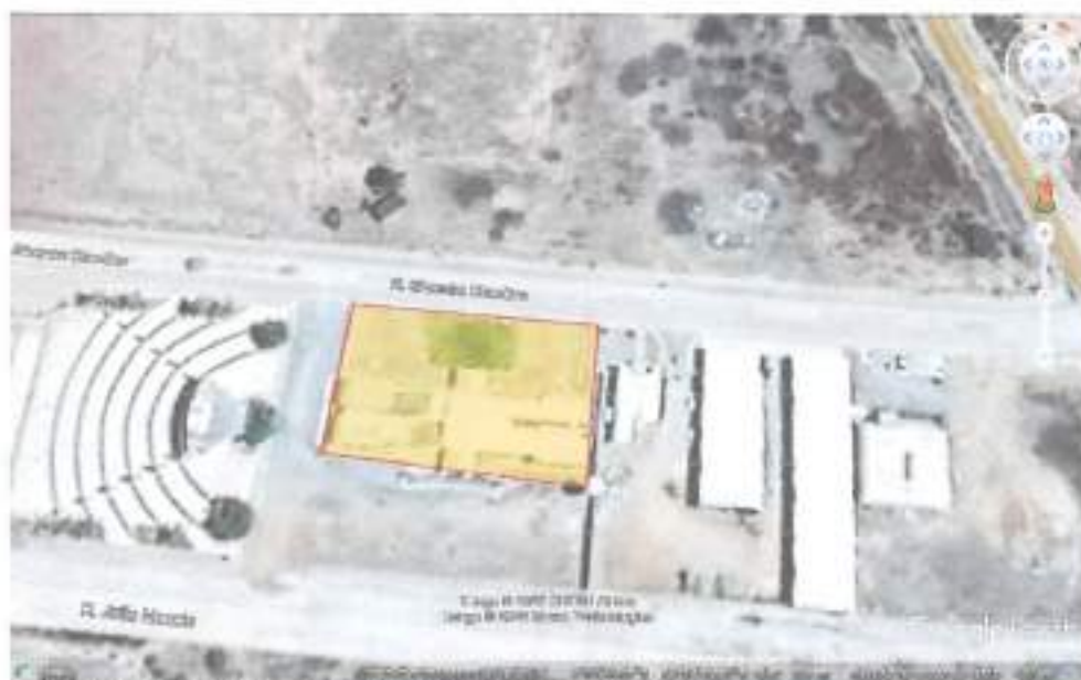
Figure 1 – Centro Administrativo